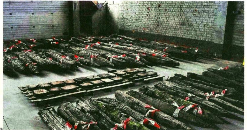
De 120 balken werden eerst geïnventariseerd en vervolgens ter beschikking gesteld van creatief Roeselare.